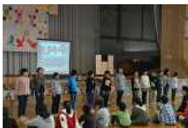
5年生によるエンディング