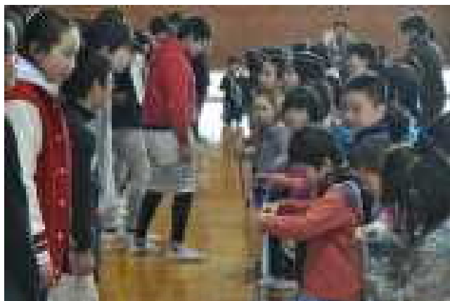
1, 2年生によるプレゼント

6年生を送る会の最後は、この会を中心になって進めてきた5年生による思い出と感謝が伝えられ、会場に集まった全員でアーチをつくり、6年生を送りました。