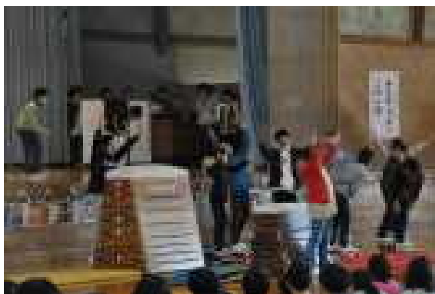
6年男子による「YouTubeのテーマ」

6年生を送る会の最後は、この会を中心になって進めてきた5年生による思い出と感謝が伝えられ、会場に集まった全員でアーチをつくり、6年生を送りました。