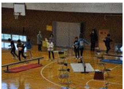
<↑5年生 サンタさんの落とし物，>