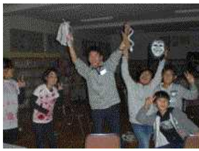
<↑6年生 高難の迷路，ジンジャーマン（おばけやしき）>