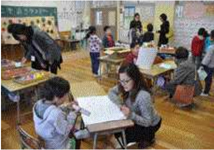
<↑1年生「あきランド」けん玉，まとあて，どんぐりめいろ>

園児や保護者の方からたくさん参加いただき、子どもたちも張り切って取り組めたウィンターフェスティバルでした（12月1日）。