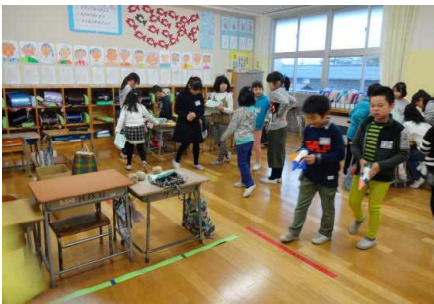
レース，ビュンビュンジャンプ，ポイントゲッター>