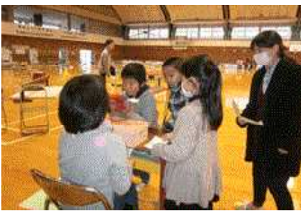
サンタさんのキーワード>