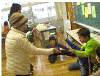
<↑3年生「3松あそびワールド」ジェスチャーゲーム，じゃんけん大会，学校クイズ>