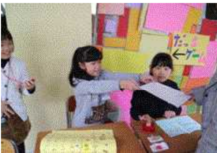
<↑4年生 ねらえ!!まとあてゲーム，カギを見つけろ!!脱出ゲーム，ツミ>