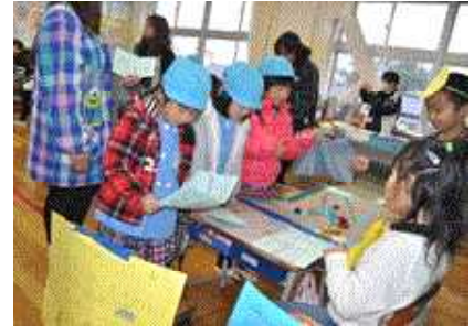
<↑2年生「スマイルランド」ポート>