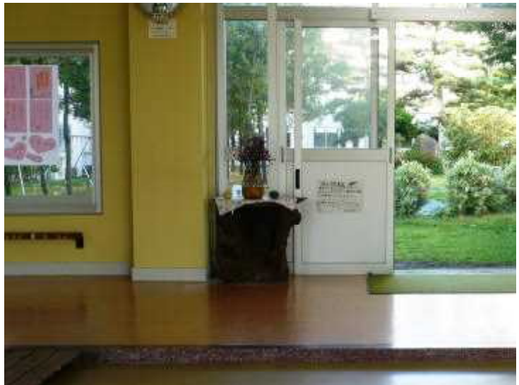
子どもたちを迎えてくれるお花

また、その下の写真は、児童玄関に飾られている花です。この花も、地域の方のご厚意で飾られています。ご自分で花を持参され、朝早くに活けてくださいます。花が子どもたちを優しく迎えてくれています。