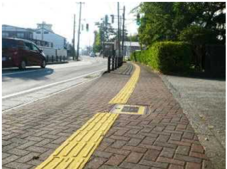
除草されたきれいな玄関

右の写真は学校の正面玄関の道路です。ここは生け垣があり、土がたまり草が生えたり落ち葉が積もったりします。この道路を朝早くにきれいにしてくださっている方がいらっしゃいます。